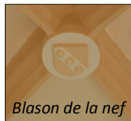
Blason de la nef

Le bâtiment est constitué d'une nef rectangulaire avec une fenêtre et d'un chœur hexagonal avec quatre fenêtres, dont l'une a été murée lors de l'installation du retable. Il est renforcé de huit contreforts.