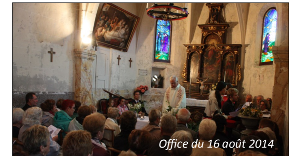
Office du 16 août 2014

Le 16 août, l'office entendu, on se livrait aux joies de la table. Si la tradition se perpétue de nos jours, la fête ne connaît plus les excès d'alors.