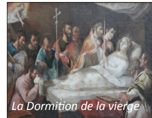
La Dormition de la vierge

Sur le mur de gauche de la nef, se trouve un tableau du 17ème siècle, classé par les Monuments Historiques « La Dormition de la Vierge » (auteur inconnu). Trois autres tableaux non classés ont disparu à la fin du 20ème siècle.