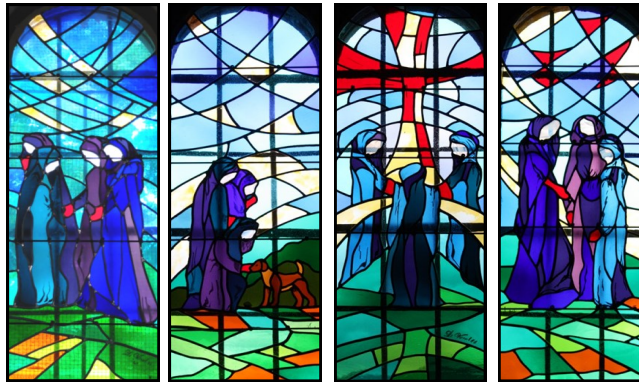
Vitraux n°1, 2, 3 et 4

Vitrail 4 : Pèlerinage à Saint Roch et chapelottes. Au fil du temps, le service rendu aux malades est réduit. Les grandes cérémonies religieuses célébreront Saint Roch au 16 août.