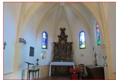
Réfection des badigeons 2014-2015