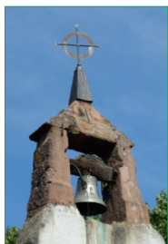
Chapelle vers 1500