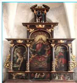
Retable Claude Bassot - 1625