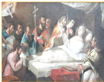
Dormition de la Vierge 17e siècle - Artiste inconnu